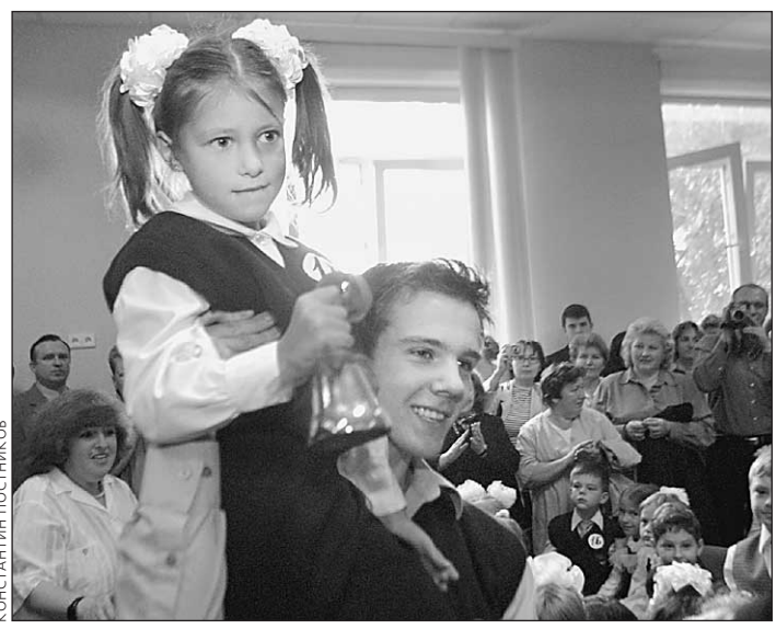
Как 1 сентября встретишь, так школьные годы и проведешь Ну вот и кончилось наше короткое «северное лето». Его конец четко обозначен Первым сентября. Школьники с ужасом считают, сколько осталось часов вольной жизни, родители делают примерно то же самое. Особенно те, чьи дети в этом году будут сдавать «экспериментальный» Единый госэкзамен.

во на сдачу экзамена в вуз. Вуз должен знать, кого он берет. Надо понимать и другое: наличие опубликованных тестов приведет к тому, что учителя, не говоря уже о репетиторах, вынуждены будут штудировать с учениками ответы на тесты в ущерб seriouslyму прохождению материала. Президент назвал три основные задачи, стоящие перед страной, — удвоение ВВП, борьба с бедностью и усиление боеспособности армии. Это действительно первоочередные задачи. Но в конце стоило бы поставить не точку, а запятую и вспомнить о насущной необходимости развития образования и науки. 5-6. Может быть, стоит в научных академических журналах, выходящих в издательстве «Наука/Интерпериодика», ввести раздел «Наука — школе».